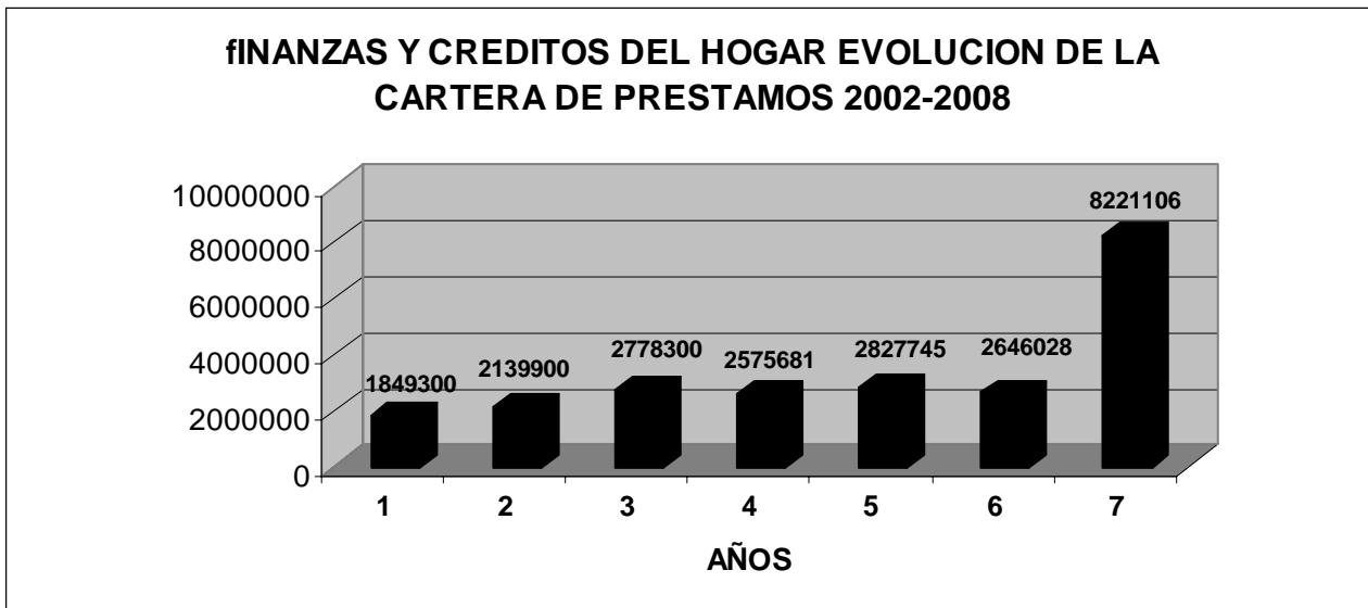
Cifras provenientes de los Estados Financieros del Emisor

A continuación un gráfico detallando el análisis de vencimiento de la cartera de prestamos para septiembre de 2008